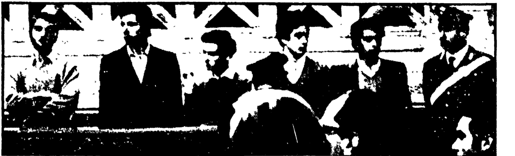
I cinque giovani sotto processo dopo l'aggressione poliziesca in piazza Cavour

In rappresentanza delle centinaia di persone che sabato scorso si scagliarono in piazza Cavour, davanti al palazzo di giustizia di Roma, alle selvagge cariche della Celeri contro ai cinque studenti, quattro avvocati hanno testimoniato, ristabilendo la verità dei fatti, davanti ai giudici della quarta sezione del Tribunale, il processo contro i cinque giovani che in quell'occasione vennero arrestati.