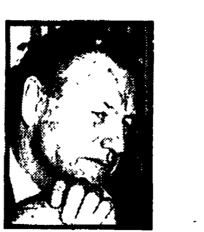
NELSON ROCKEFELLER. Migliori occasioni