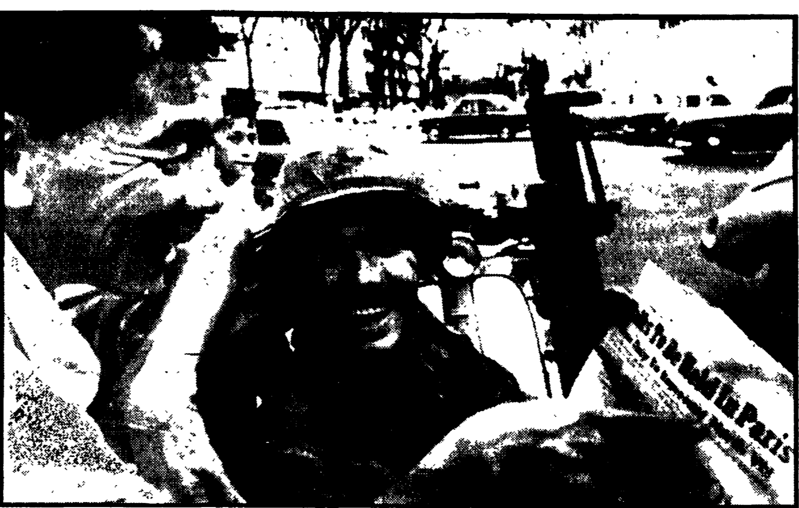
SAIGON — Un soldato della 9. divisione di fanteria americana, milia di un « ciclotaxi » danno sfogo al loro entusiasmo, leggendo l'annuncio della trattativa a Parigi