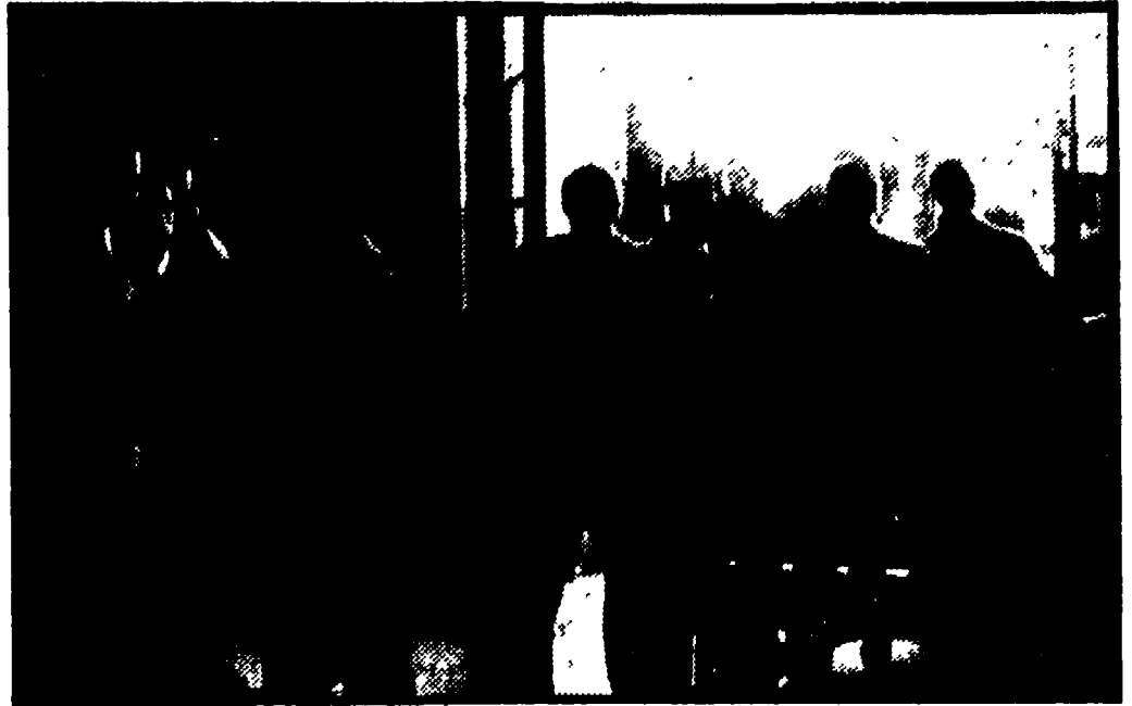
I ricercatori dentro l'istituto occupato

I ricercatori del CNR hanno continuato ieri l'occupazione - Domani terranno una conferenza stampa sul rapporto dell'OCSE