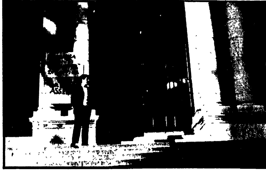
Cartelli che annunciano la lotta a Ingegneria

Gli studenti denunciano l'atteggiamento delle autorità accademiche e si riuniscono in assemblea permanente