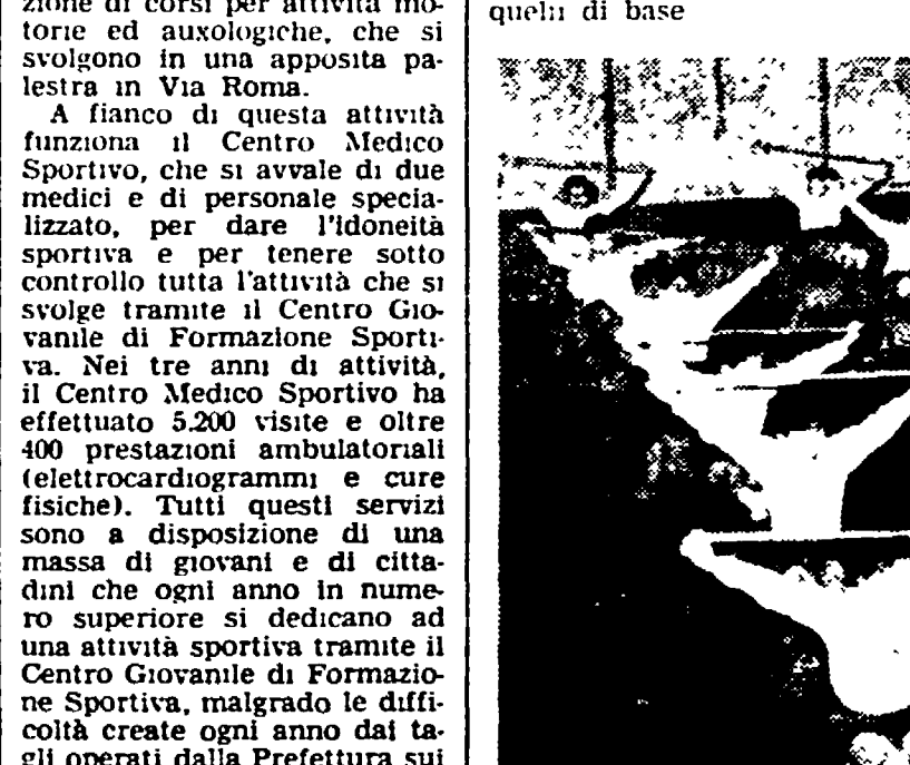
Un delle squadre del corso «giovanissimi» per ragazzi del secondo ciclo delle scuole elementari. Il «centro giovanile di formazione sportiva» è diretto dal Comune di Prato