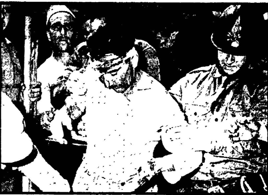
Gli incidenti sul lavoro: non se ne parla

te si aggiunge che, però, gli stessi vietcong bombardano ancora un certo ponte. Nel frattempo viene mostrato un filmato che inquadra un ponte sul quale passano donne e bambini, e la voce di Levi informa che questo è il ponte che collega Saigon alla periferia. Poi dopo brevi annunci sul Papa che prega e su U Thant che auspica la pace, ecco Demetrio Volic che parla delle truppe russe al confine della Cecoslovacchia, e drammaticamente, informa sul richiamo urgente dell'ambasciatore USA a Praga, India, dalla capitale USA, un portavoce ufficiale, rassicura che gli americani tengono d'occhio la situazione e si tengono pronti. In un secondo collegamento, Citterich per circa 3 minuti insiste sul fatto che le «Isvestia» hanno attaccato duramente il tentativo di liberarsi - «giustamente» dice lo speaker - dal «pesante giogo dell'URSS».