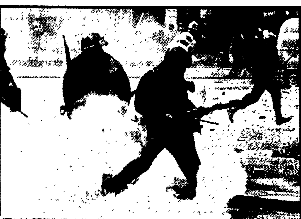
La polizia francese all'attacco: non si è vista

13 MAGGIO: nel Telegiornale delle 13,30 erano riportate le seguenti notizie: attentato nel centro di Saigon (40 secondi); 99,99% di voti favorevoli nel referendum proposto da Nasser in Egitto (35 secondi); deplorazione ufficiale dell'ONU a Israele per la parata del 2 maggio (15 secondi); trascritti discorsi di Eshkol e Eban affermandi che Israele non ritornerà mai più nel conflitto precedente (50 secondi).