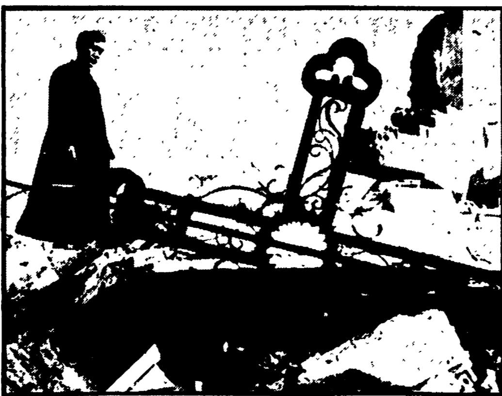
I bombardamenti americani sul Vietnam: la consegna della TV è « silenzio »