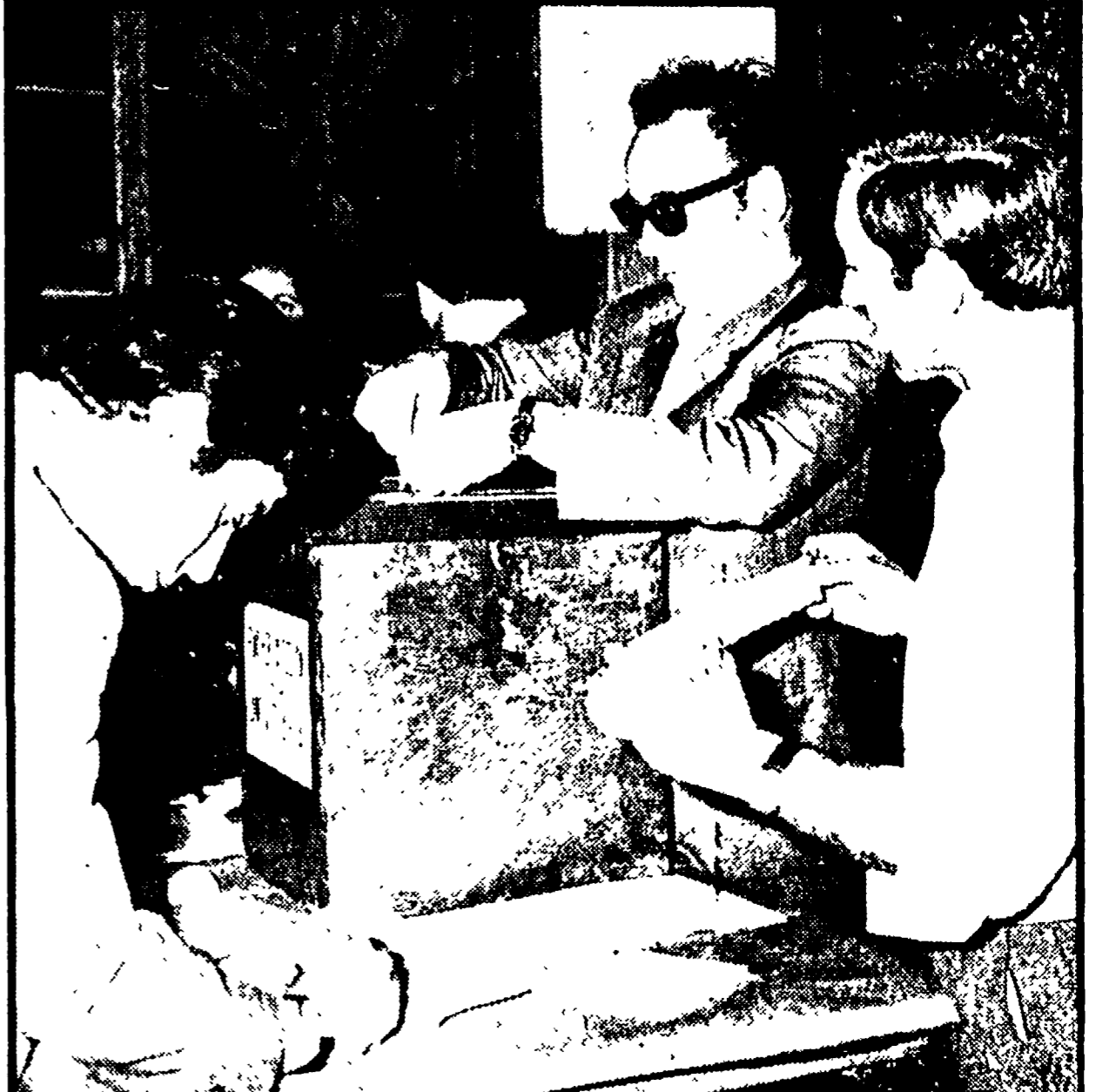
L'insediamento di un seggio elettorale a San Lorenzo

Le 2694 sezioni elettorali del comune di Roma sono state insediate ufficialmente ieri pomeriggio dalla presenza dei presidenti, scrutatori, rappresentanti di lista e di numerosi cittadini. Sbrigate le formalità di legge, da questa mattina alle ore 7 si può andare a votare: i seggi rimarranno aperti fino alle 22 in serata, ripriranno le mani mattina alle 7 per essere chiusi improrogabilmente alle 14 di domani lunedì. Il voto di oltre un milione e 700 mila schede per le elezioni della Camera e circa un milione e 450 mila schede per il Senato. Le operazioni per il conteggio dei voti avranno inizio lunedì pomeriggio, subito dopo la chiusura del seggio, e si protrarranno fino alla loro conclusione.