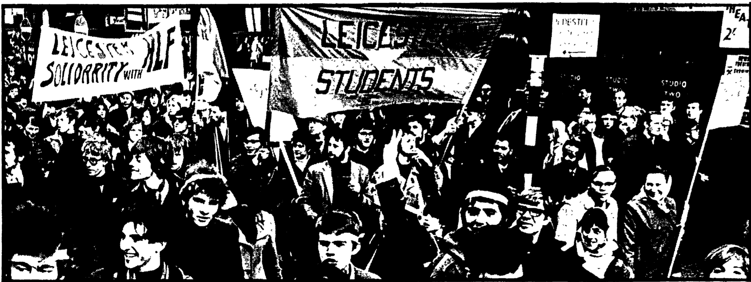
LONDRA - Studenti inglesi in corteo durante una recente manifestazione contro l'aggressione americana al Vietnam

Il malessere giovanile di fronte al fallimento laburista - Politizzazione crescente - Un ministro minacciato di essere gettato nella fontana e un diplomatico degli Stati Uniti verniciato di rosso - Si costruisce una nuova organizzazione studentesca