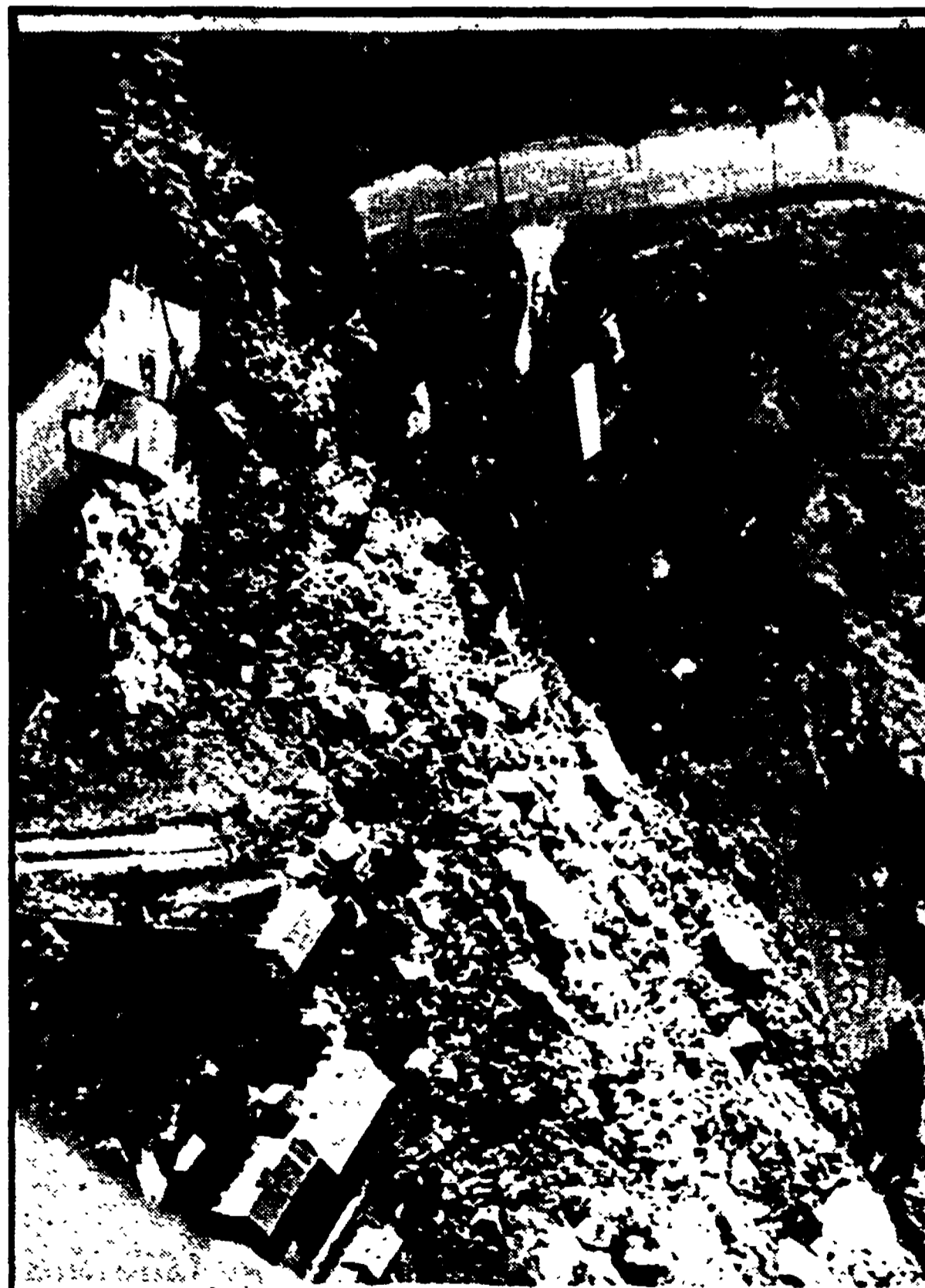
CROLLA UNA COLLINA Un'intera collina è franata sulla strada statale presso Ancona. Case, costruzioni sono state trascinate nella valle come birilli. Un villaggio era stato abbandonato in tempo, ma si sospetta che una donna sia rimasta sepolta dalla valanga di terra.

La tragedia nei pressi di Chieti - L'omicida, arrestato, ripete: «Sentivo una voce dentro... Che ci provino loro, se sono capaci» - Si è vendicato di alcuni scherzi - Un paese sconvolto