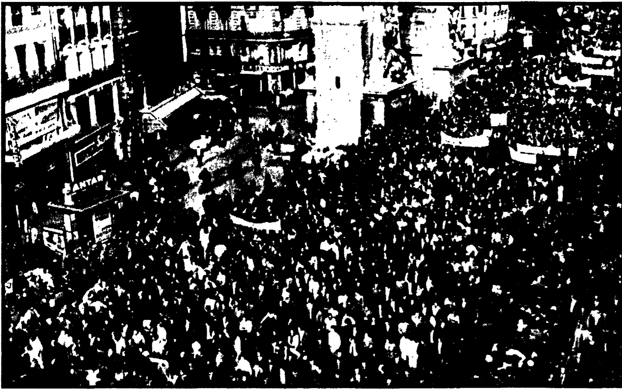
PARIGI — Operai in corteo sfilano davanti all'Arco di Trionfo della Porta Saint Denis