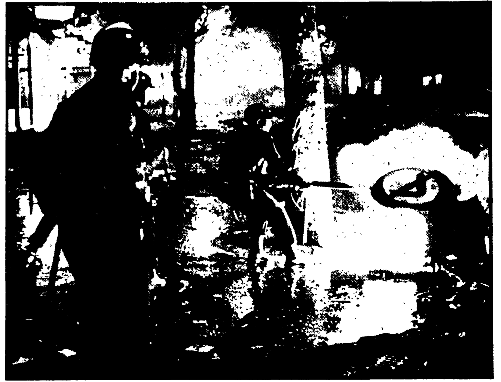
« Paris brûle »: Parigi brucia. I dimostranti durante la notte hanno appiccato fuoco a tutto ciò che poteva bruciare per fermare le cariche di polizia. Un poliziotto tenta di spegnere un incendio servendosi di un cartello della segnaletica stradale