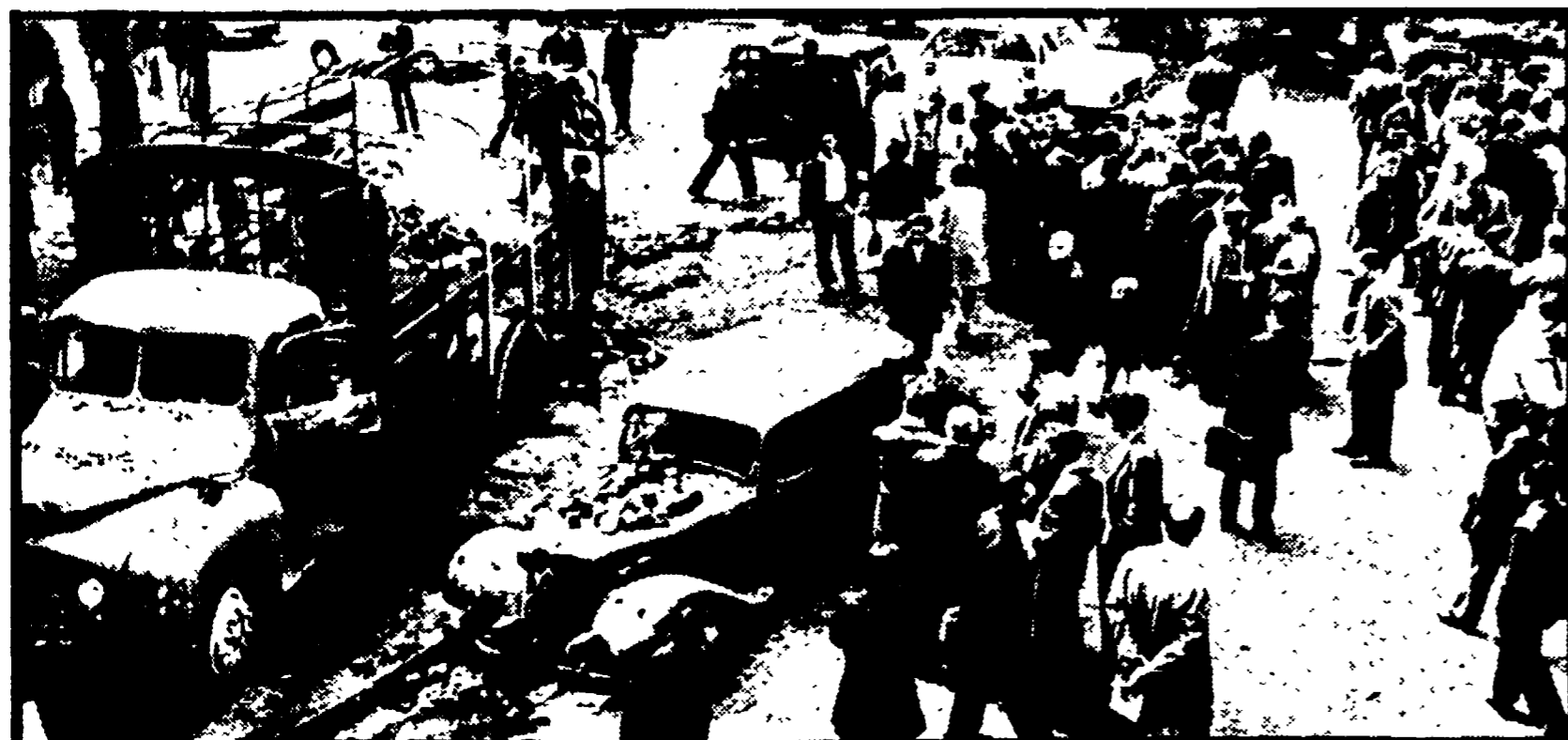
PARIGI — Una barricata nei pressi della Borsa (l'edificio con colonne nello sfondo) che i manifestanti hanno dato alle fiamme (in alto). Sotto: piazza Manbert, nel quartiere Latino, ieri mattina. Terribili tracce della notte di battaglia.