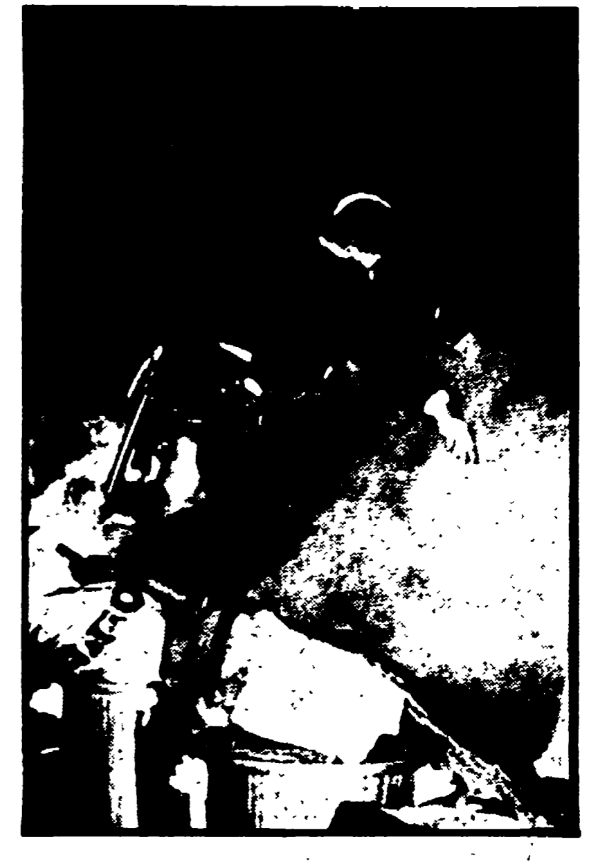
PARIGI — Poliziotti scavalcano una barricata in Rue de Lyon per caricare i dimostranti