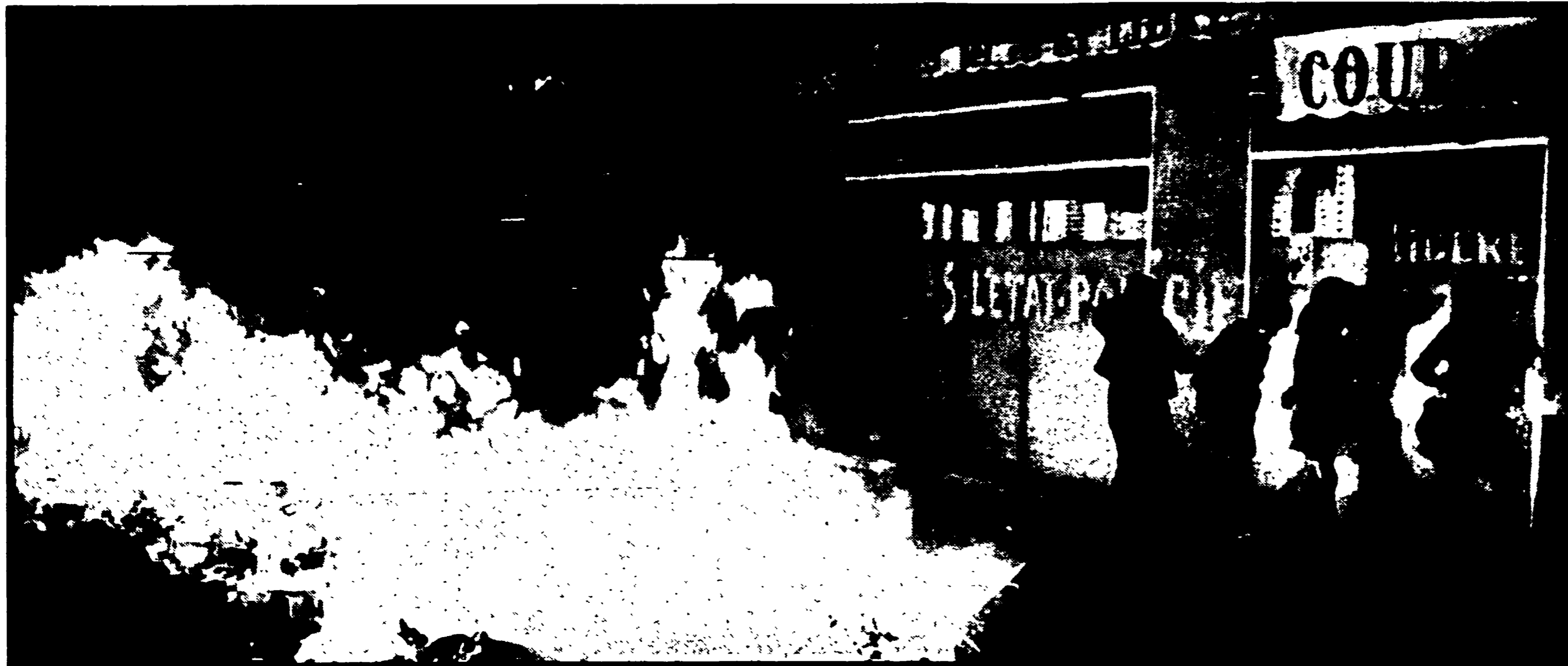
Dappertutto gli incendi. Qui alcune ragazze in minigonna rosentano il muro lungo il mercatopiede di via Gay-Lussac, coprendosi il volto per evitare lo scintillio dell'incendio