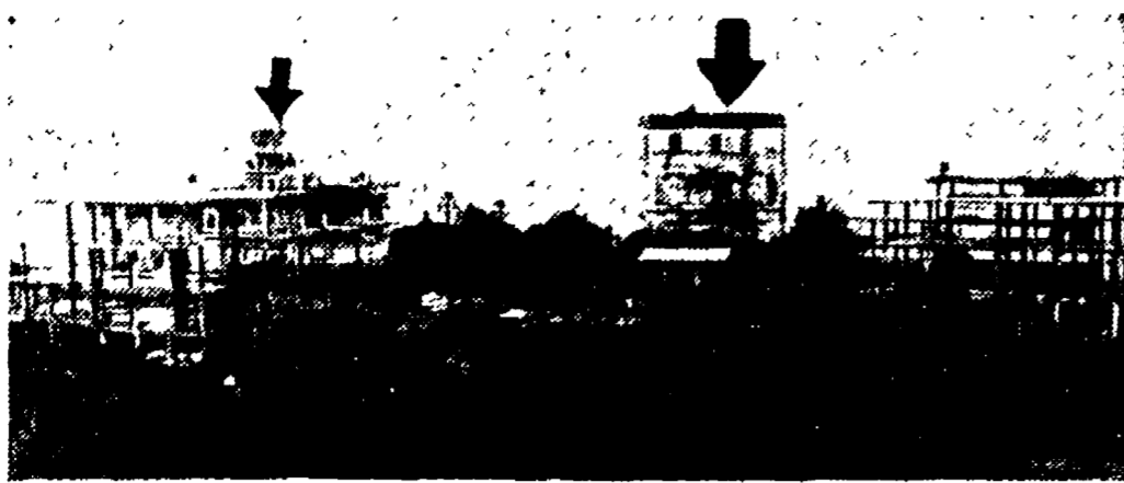
I due fabbricati della «Immobilare De Lieto» alla via Marechiaro: dopo 16 mesi di sospensione, il Comune, invece di ordinare la demolizione delle parti abusive, ha rinnovato la licenza edilizia.

Una nuova licenza edilizia permette lo scorcio che pareva scongiurato