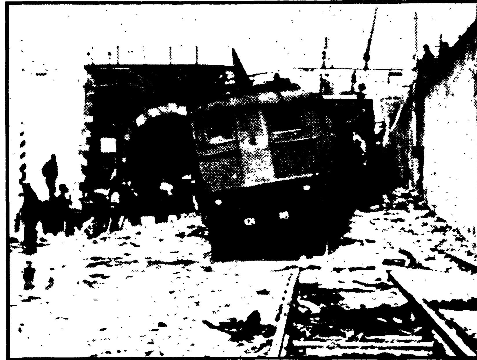
REGGIO CALABRIA - Il convoglio ferroviario deragliato a causa di una frana tra le stazioni di Bagnara e Favazzina

Trentacinque feriti - Il locomotore e il primo vagone rovesciati sui binari poco dopo Bagnara