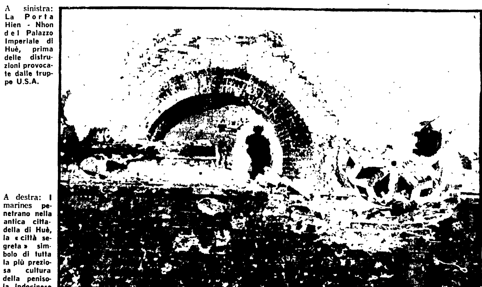
A sinistra: La Porta Hien Nhon e il Palazzo imperiale di Huè, prima delle distruzioni provocate dalle truppe U.S.A.