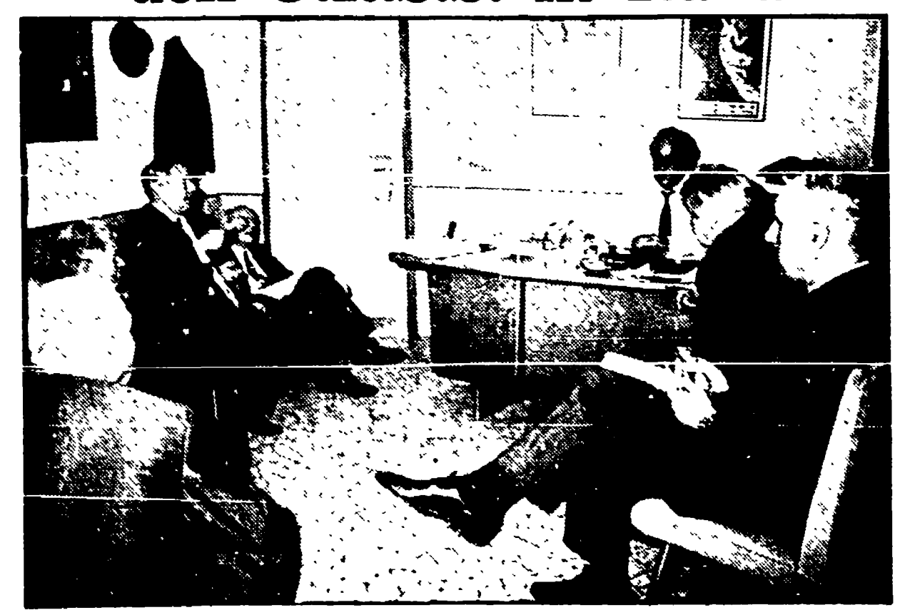
Una delegazione di scrittori dell'Unione Sovietica, di cui fanno parte A. Tvardovski, J. Abtchina, K. Simonov, A. Surkov e J. Breilbov, in visita in Italia è stata ricevuta ieri mattina dal compagno Luigi Longo.

Novella Sansoni. «Quando questo avverrà, in una casa quadrata e grigia, in una terra sterile, e accanto a quella casa grigia c'è una lontana battaglia, la Battaglia dei Cento Uccisi (1865)»