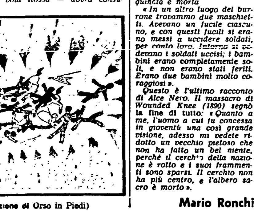
La battaglia di Custer (illustrazione di Orso in Piedi)

Questo è l'ultimo racconto di Alec Nero. Il massacro di Wounded Knee (1890) segnò la fine di tutto... «L'uomo a cui tu concessa in gioventù una così grande visione, adesso mi vedete ridotto un vecchio puzoso che non ha fatto un bel niente»