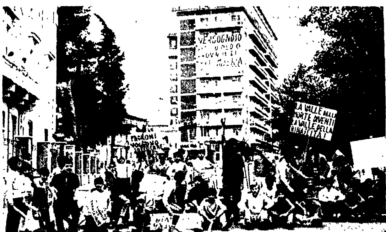
Due aspetti dello sciopero generale di Lanciano che martedì scorso ha paralizzato la cittadina abruzzese. In alto: piazza del Plebiscito gremita di folla. In basso: gli studenti attendono il corteo operaio con cartelli che solidarizzano con la lotta delle tabacchine