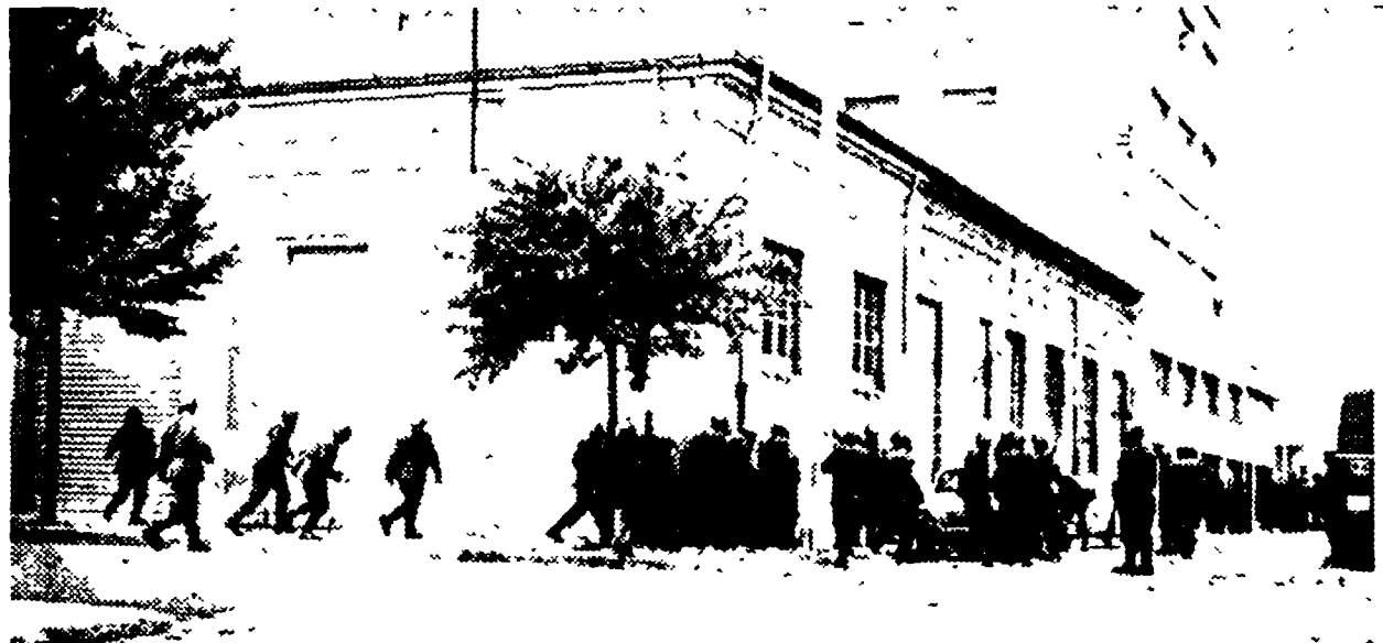
Poliziotti in pieno assetto di guerra a Lanciano

Il responsabile di zona del Partito comunista fermato mentre stava diffondendo l'«Unità» - Prosegue l'occupazione dell'ATI