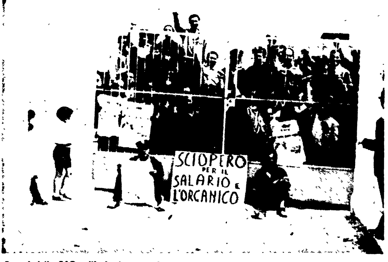
Operai della SAP nell'azienda occupata

I netturbini hanno strappato l'orario unico di sette ore e mezzo e l'ampliamento dell'organico