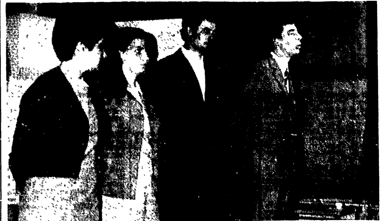
Un lunghissimo successo hanno riscosso presso la Casa del Popolo di Dogna (Castelfiorentino) il gruppo Teatro Studio di Empoli e il gruppo di Teatro Sperimentale di Castelfiorentino che hanno messo in scena lo spettacolo «L'uomo è uomo». Si tratta di un lavoro — ricavato da testi di Franco Antonicelli, Bertolt Brecht e Lauro Olmo — che venne rappresentato qualche tempo addietro a Montelupo Fiorentino, dove riscosse un lunghissimo successo. Tale affermazione e le richieste avanzate da numerose Case del Popolo dell'Empolese hanno spinto le due compagnie a riprendere le rappresentazioni, mettendo nuovamente in scena lo spettacolo. Un grande successo ha, infatti, riscosso anche la rappresentazione svoltasi a Casenove di Empoli. Nella foto: una scena dello spettacolo.