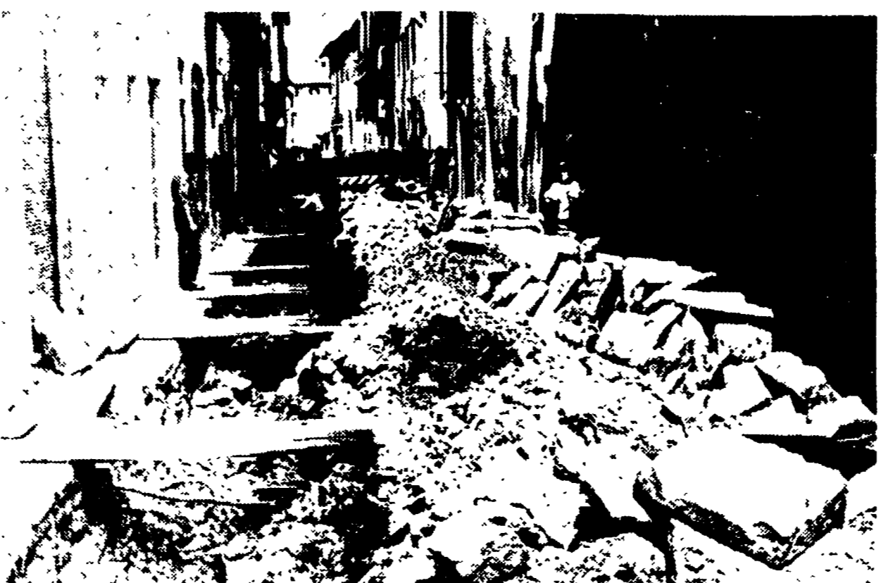
Via della Chiesa: da tempo immemorabile questa strada è soggetta a ripetuti lavori (per lo acquedotto, per le fogne, etc.)...