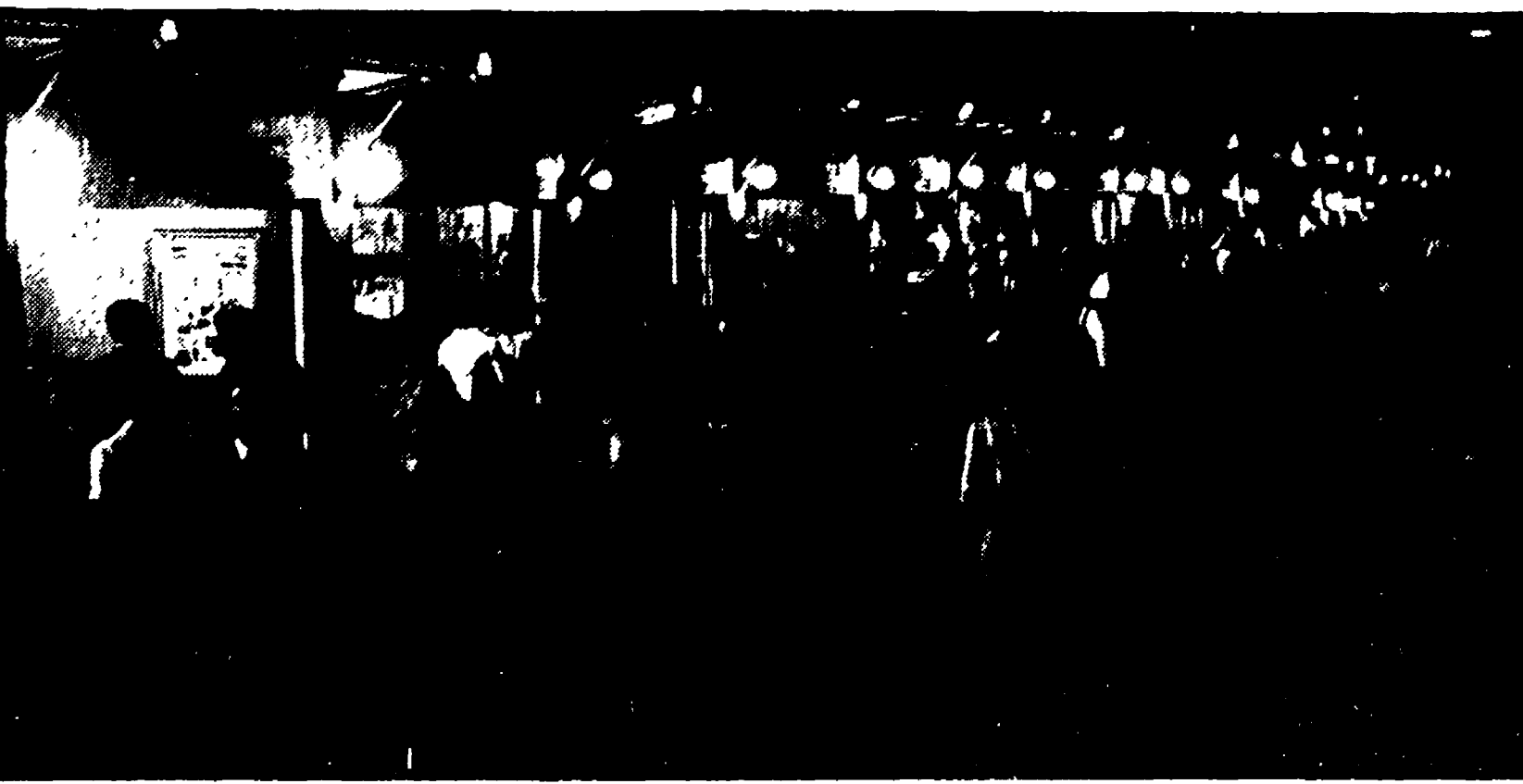
I romani passeggiano in via di S. Eligio illuminata dalle botteghe degli antiquari