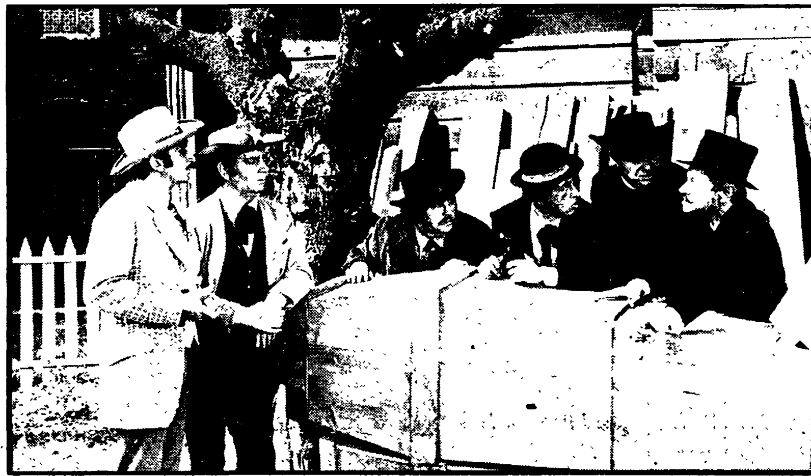
In alto: un'inquadratura di «Tutto Totò». Qui sopra: una scena di «Non cantare, spara»

«... Per quello che può valere le dirò che Non cantare, spara ai tedeschi è piaciuto. Senza offesa: peggio per loro. E quanto alla sua regia? Mi sono sforzato di confezionare un prodotto grammaticalmente esatto. Lo sapevo bene, in partenza, che il genere è molto friabile e che, dopo tutto, stavo cercando di mettere un vestito pulito su un corpo senza gambe. Dai critici però avrei preferito un atteggiamento meno aprioristico. Capisco che ciascuno venga misurato anche su quello che ha fatto prima, ma l'eclettismo non dovrebbe essere considerato subito una colpa.»