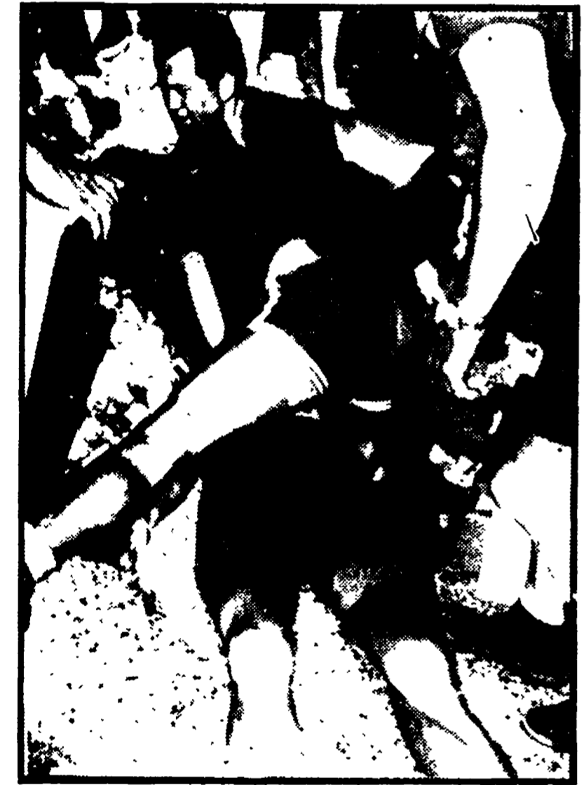
TOM SIMPSON ucciso dal doping sul Mont Ventouse. Il campione inglese aveva fatto ricorso alla chimica moderna per resistere agli attacchi degli scalatori...