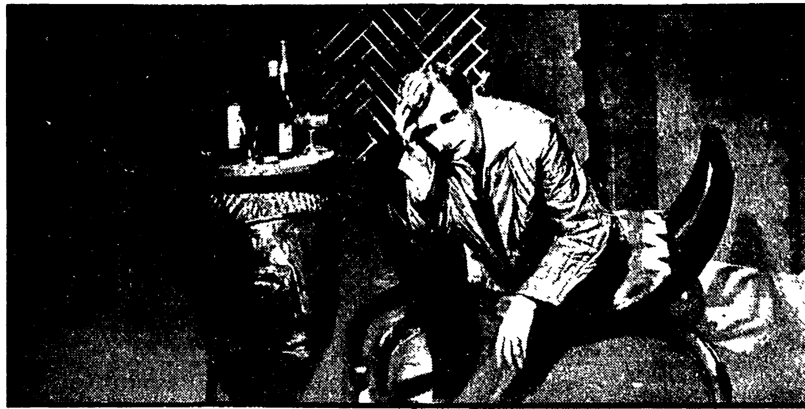
Una scena del «Dottor Mabuse» di Lang