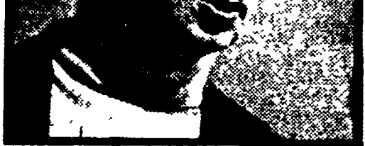
Ernesto Cailinri presentatore di «Diva» in alta linea»

GIORNALE RADIO, ore 7, 8, 10, 12, 13, 15, 17, 20, 23 6,30 Musica stop 7,37 Parole e disegni 7,47 Pari e dispari 8,30 La canzone del mattino 9,00 Parole e cose 9,05 Colonna musicale 10,05 La ore della musica 11,22 La nostra salute 12,05 Contrappunto 12,37 Si o no 12,42 Quadrinetto 12,47 Punto e virgola 13,20 Appuntamento con Fausto Cigliano 14,00 Trasmissioni regionali 14,37 Listino Borsa di Milano 14,45 Zibaldone Italiano 15,10 Autoradiorivista d'estate 1968 15,45 I nostri successi 16,00 Programma per i ragazzi 16,30 Concerto per Naninella 17,05 Musica sinfonica 18,10 Cinque minuti di inglese 18,45 Per voi giovani 19,10 Sui nostri mercati 19,15 Lo scialle di Lady Hamilton 19,20 Luna-park 20,15 I treni che vedeva passare 21,27 Intervallo musicale 21,42 Concerto sinfonico