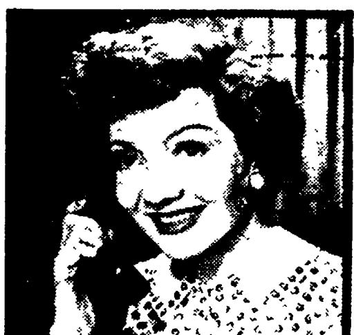
Claudette Colbert in «Nozze infrante»

21.00 TELEGIORNALE 21.15 NOZZE INFRANTE Film 22.45 L'APPRODO Settimanale di lettere ed arti