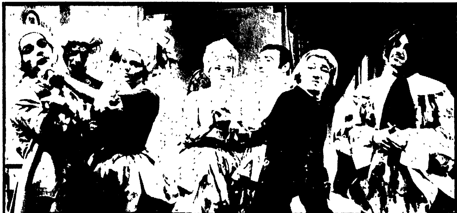
Una scena dell'Imbroglione di due ritratti di Carlo Goldoni