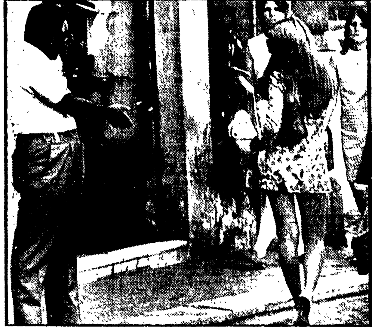
Passa una minigonna per la strada e un romano commenta apertamente. Un commento favorevole, c'è da giurarcelo, considerata la minigonna in questione