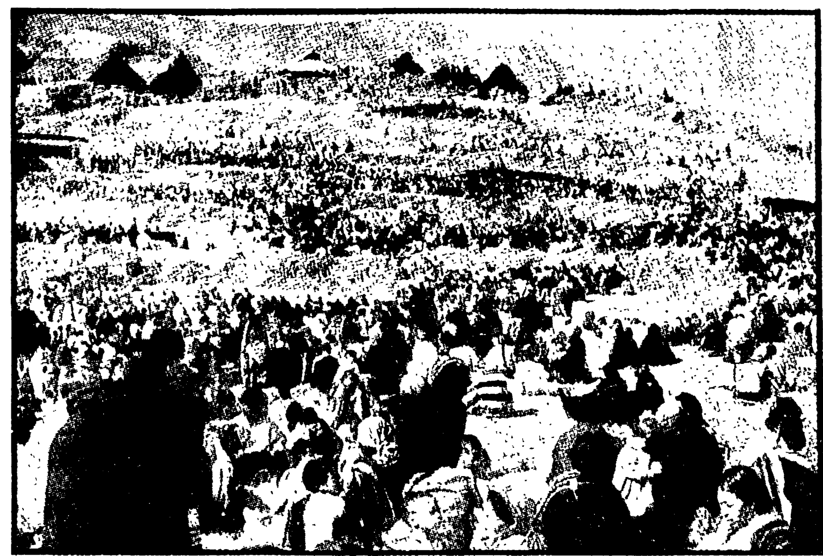
Un singolare esempio di quella che potremmo chiamare «democrazia diretta primitiva» è offerto dal popolo Naga, in lotta per conquistare l'indipendenza dall'India del suo piccolo territorio collinoso ai confini con la Birmania...