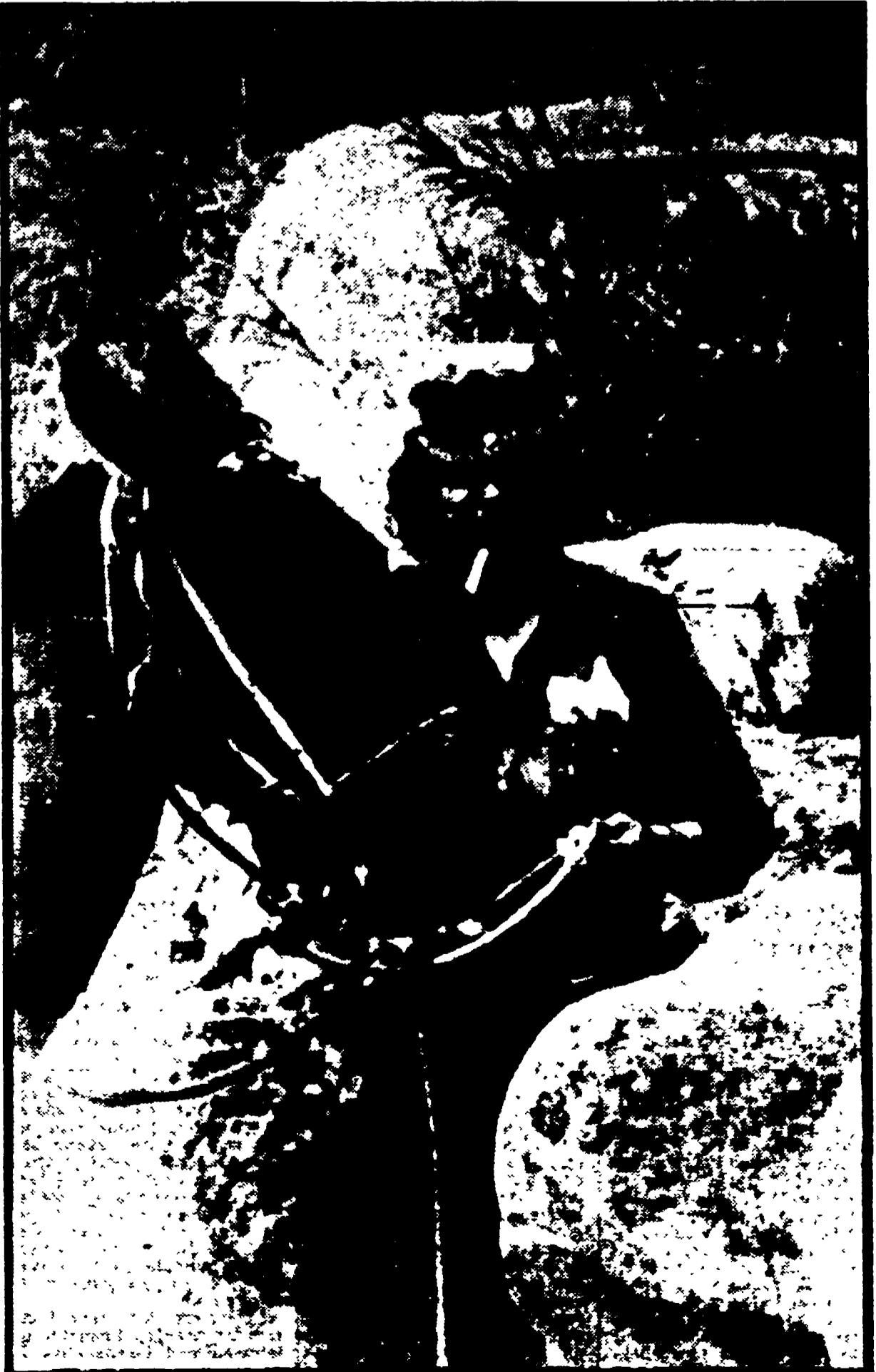
NEW YORK — Questa è una delle ultime foto del Comandante «Che» Guevara, qui riprese accanto al suo inseparabile mulo Chico. E' stata scattata nel settembre del 1967, qualche settimana prima che l'eroico comandante fosse assassinato. La foto appare in un libro che oltre al Diario ormai famoso in tutto il mondo pubblica quelli che vengono definiti «altri documenti»

Un ultimatum al governo perchè destituisca le autorità civili e militari responsabili dei gravi incidenti della settimana scorsa - Lunedì marcia di protesta di 150 mila persone, ieri nuova dimostrazione con 50 mila partecipanti