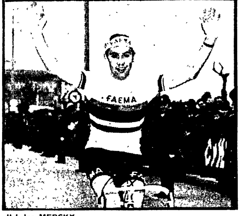
Il belga MERCKX