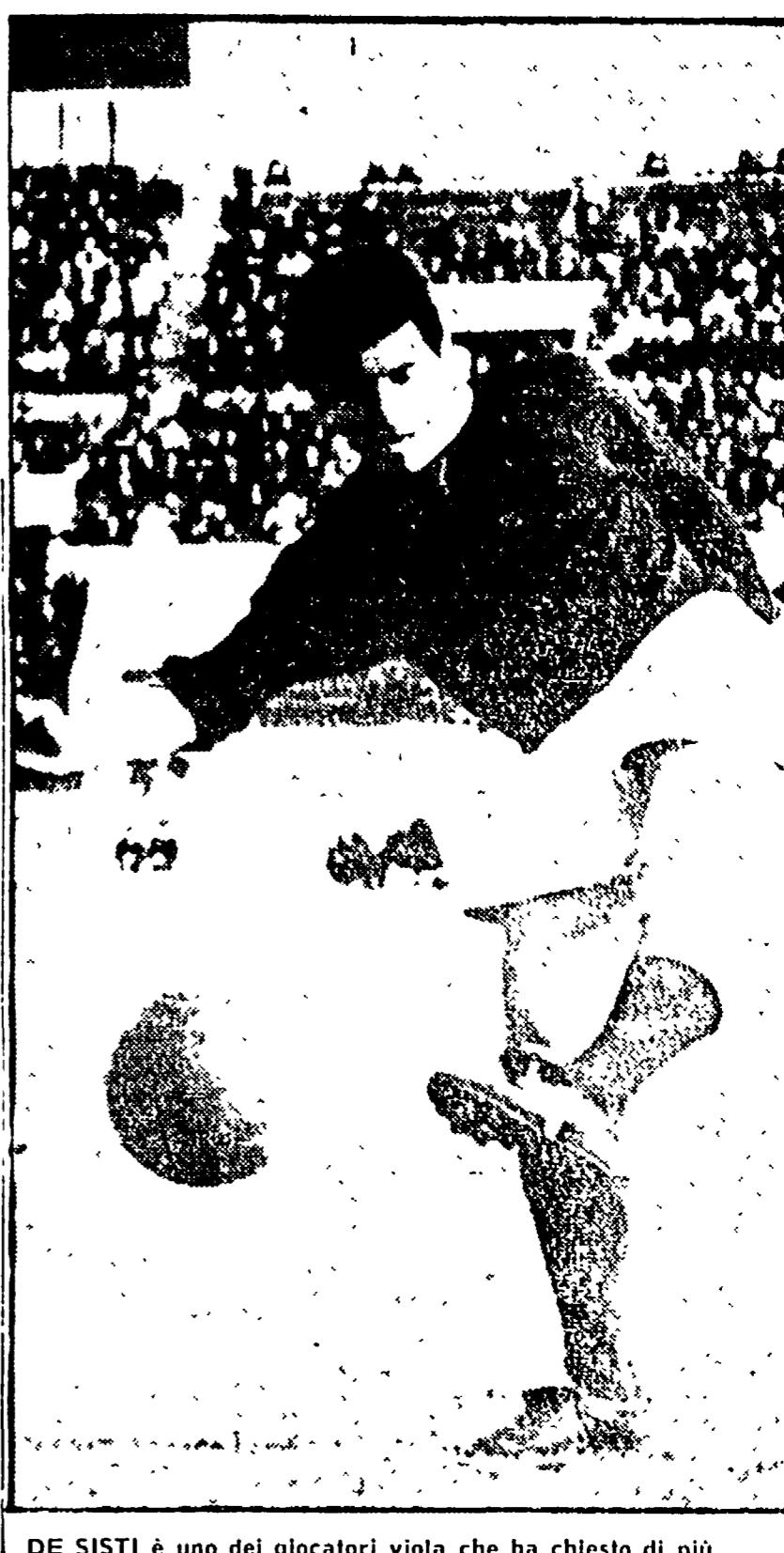
DE SISTI è uno dei giocatori viola che ha chiesto di più