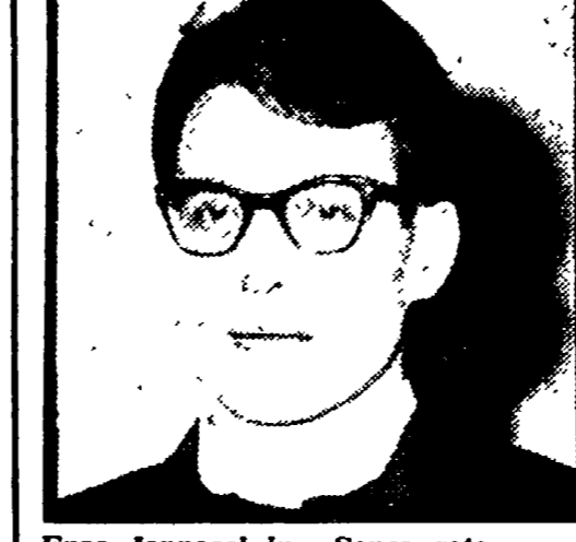
Enzo Jannacci in «Senza rete»

21.00 TELEGIORNALE 21.15 LA MACCHINITE Originale televisivo di Raffaello Baldini 22.35 MATITA BLU Note di costume a cura di Vittorio Marchetti