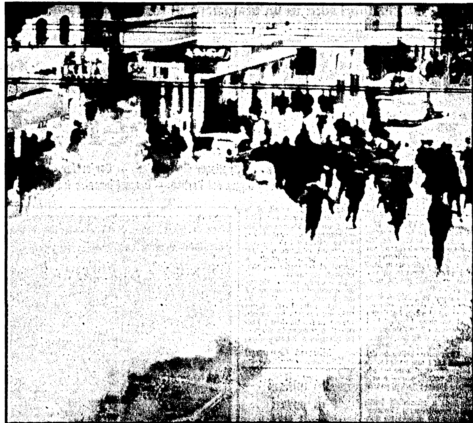
MONTEVIDEO— La polizia aggredisce gli studenti lanciando bombe lacrimogene

Corea del Nord. Un portavoce sudcoreano ha affermato che le truppe della Corea del sud avrebbero ucciso in combattimento otto nordcoreani, in due diversi scontri avvenuti prima dell'alba, al confine fra i due Stati coreani. Come d'abitudine, il portavoce sostiene che i quattro nordcoreani, assieme ad altri in numero imprecisato, avrebbero cercato di « infiltrarsi » nella Corea del sud, cercando di superare una posizione militare sudcoreana. Il portavoce, dopo aver detto che un solo soldato sudcoreano sarebbe rimasto ferito in tale azione, ha affermato che nell'ultima settimana sarebbero stati uccisi, alla frontiera fra i due Stati, quindici nordcoreani, un soldato americano e tre sudcoreani.