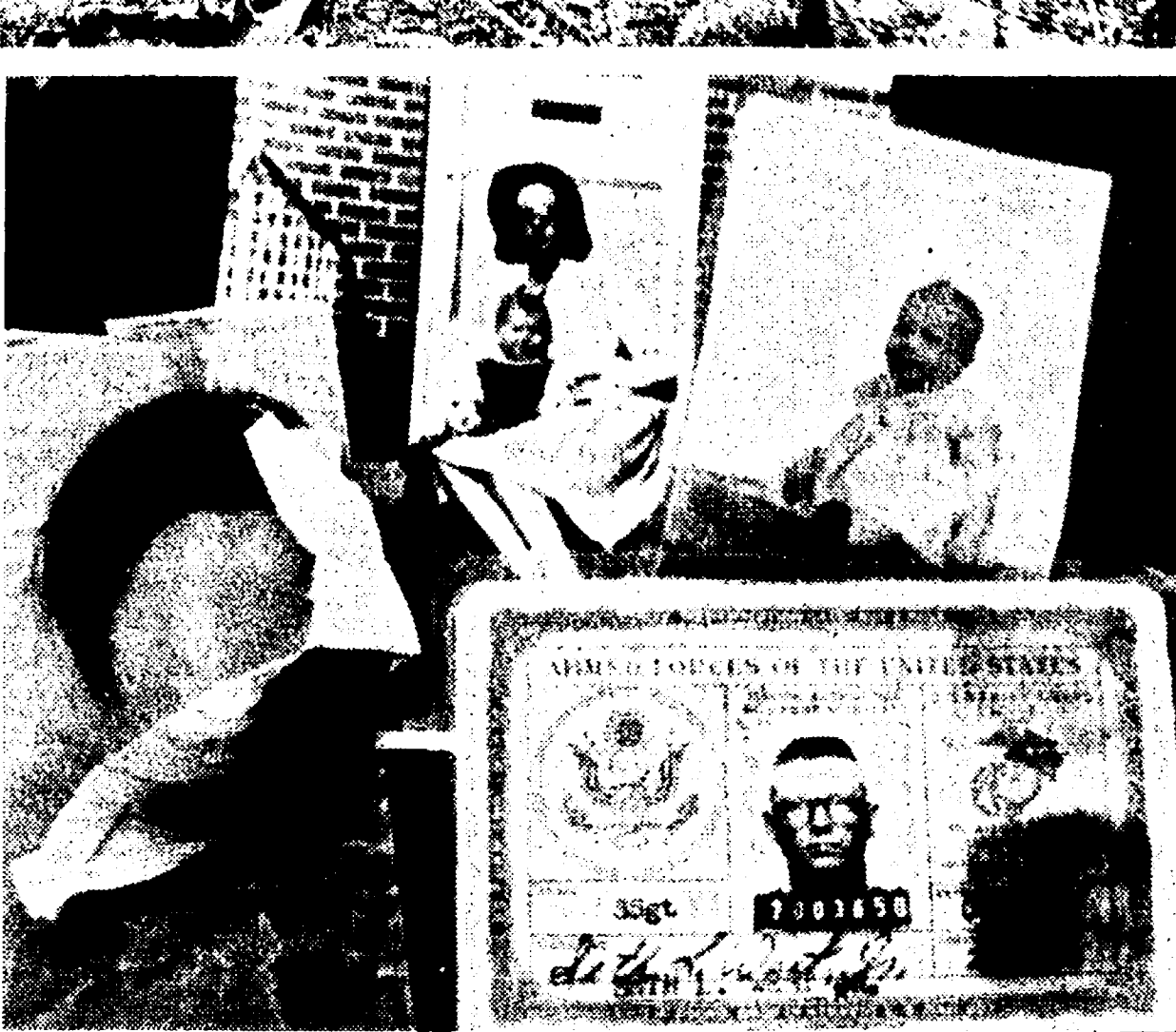
Questi due drammatici documenti fotografici sono stati diffusi dall'agenzia di notizie vietnamita con questa didascalia: «Sull'orlo fronte di battaglia di Khe Sanh - La tragedia degli aggressori: vanno a morire a Khe Sanh accompagnati dai ricordi dei loro cari». In alto: caduti americani sul campo di battaglia. In basso: una tessera personale, fotografie di una moglie e dei bambini, una ciacca di capelli.