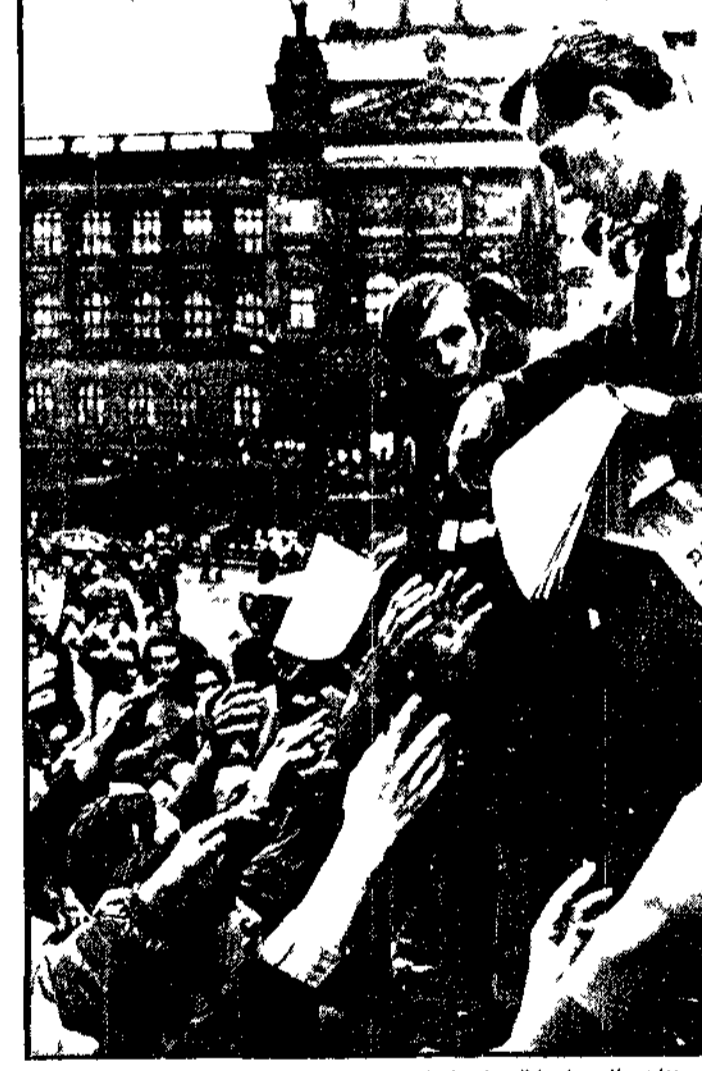
PRAGA — I cittadini fanno folla per ricevere le copie dei giornali in piazza Venceslav

«Ma noi abbiamo interesse...» «Ma noi abbiamo interesse...» «Ma noi abbiamo interesse...»