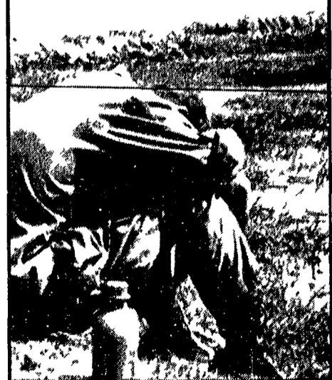
DOPO LA BATTAGLIA - DONG TAM - Soldati americani sono scesi dall'elicottero e sono seduti, esausti, accanto al loro armamento...