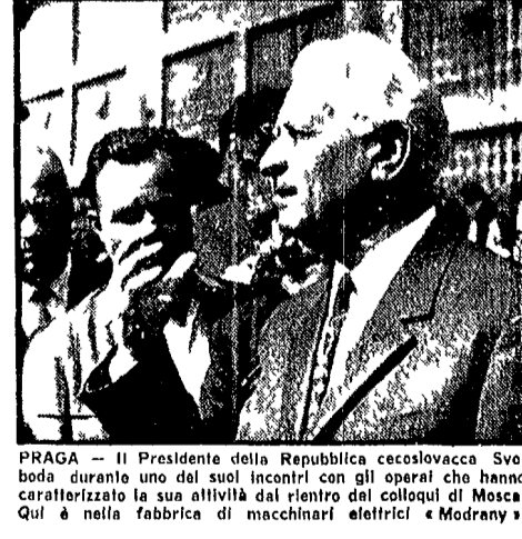
PRAGA - Il Presidente della Repubblica cecoslovacca Svoboda durante uno dei suoi incontri con gli operai che hanno caratterizzato la sua attività dal rientro dai colloqui di Mosca...