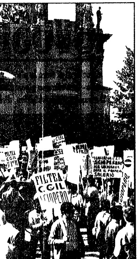
FIRENZE - La protesta degli operai calzaturieri in piazza della Libertà davanti all'VIII Compignoraria della Calzatura