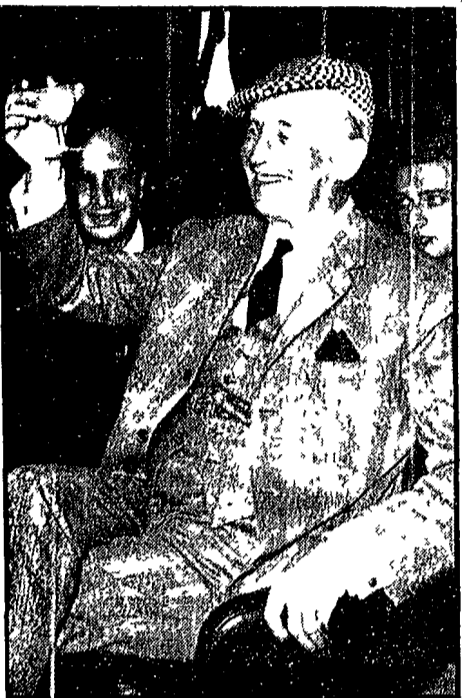
PARIGI - Maurice Chevalier celebrerà domani sera giovedì al Lido di Parigi il suo ottantesimo compleanno. L'inframontabile asso della canzone e della rivista parigina è tornato ieri sera da una tournée che lo ha condotto in vari paesi del Nord America dove ha conseguito uno strepitoso successo. Ai giornalisti, che lo accoglievano ad Orly, Chevalier ha detto che spera anche di festeggiare al Lido il suo novantesimo compleanno, tra dieci anni. Nella foto: Chevalier brinda appena giunto a Parigi

La vena umoristica e quella « seria » del compositore italiano - Novità di Maderna e di Boulez