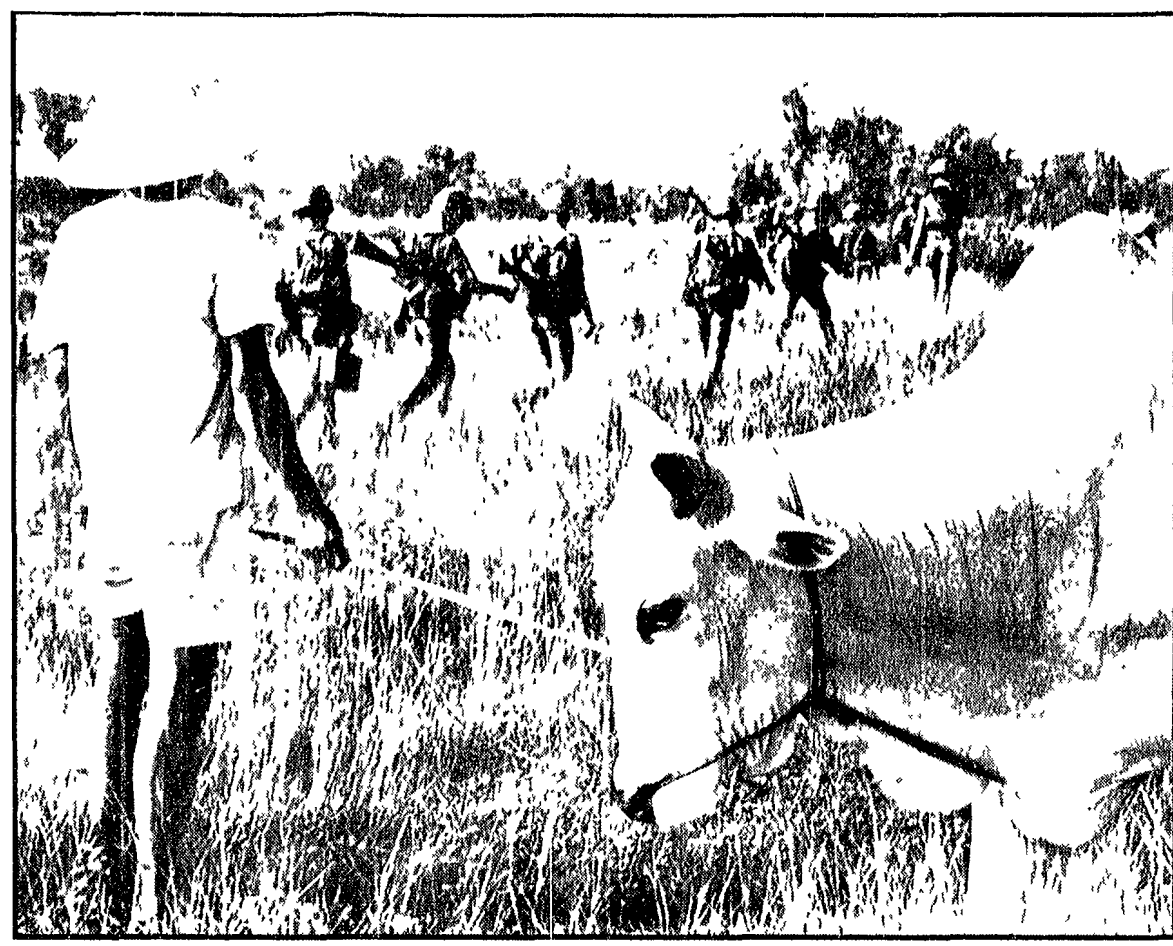
HOC MON (Vietnam del Sud) — Un reparto collaborazionista rastrella una zona a sei miglia da Saigon, alla ricerca di guerriglieri...