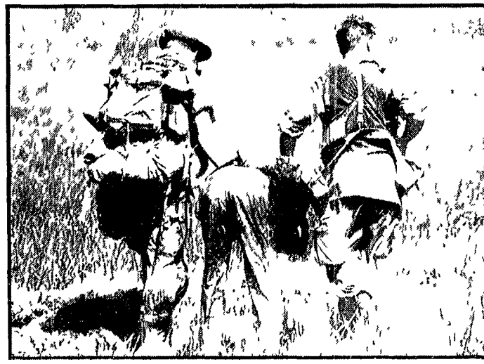
CU CHI - Due paracadutisti americani hanno catturato un patriota vietnamita e lo stanno trascinandolo brutalmente, con le mani legate dietro la schiena

gli USA hanno ammesso di aver perso un numero imprecisabile di uomini e di aver distrutto un gran numero di impianti e depositi. I rinforzi inviati sul posto dal comando USA (due mila paracadutisti sudvietnamiti e fanti americani) non sono riusciti ad agganciare le forze partigiane e si sono dovuti accontentare di rientrare nei villaggi e nelle basi distrutte e a commerciare a fate un bilancio dei danni subiti. La guarnigione partigiana non ha tuttavia cessato di battere il nemico. Cinque avamposti del regime fantoccio sono stati colpiti da decine di granate di mortaio in un raggio di venti chilometri dal centro di Tay Ninh. Nel villaggio fantoccio di Tay Ninh la punta della battaglia si è conclusa con una pesante sconfitta per gli americani. Le forze del Fronte Nazionale di Liberazione, che era avanzato attaccato imponentemente di buona parte dei villaggi del circondario e delle posizioni avanzate USA e del regime fantoccio occupando i quartieri periferici e disperdendo la nutrita guarnigione collaborazionista nel corso della notte si sono ritirate dopo aver distrutto impianti e depositi di importanza militare. I rinforzi inviati sul posto dal comando USA (due mila paracadutisti sudvietnamiti e fanti americani) non sono riusciti ad agganciare le forze partigiane e si sono dovuti accontentare di rientrare nei villaggi e nelle basi distrutte e a commerciare a fate un bilancio dei danni subiti.