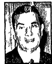
MORO - Silenziose consultazioni mondane