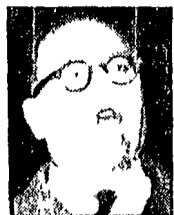
RESTIVO - Piani di repressione e «spruzzate d'acqua»