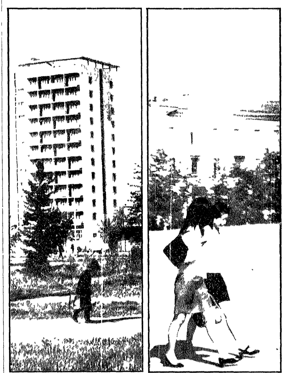
ULAN BATOR - Due aspetti della capitale della Mongolia. Le moderne abitazioni che si incontrano all'ingresso della città giungendo dall'aeroporto. A destra ragazze in minigonna a passeggio in piazza Sucho Bator

La questione non è molto semplice. Il fatto che il calore si sia accumulato sulla sonda è un fenomeno che si è verificato in modo spontaneo. La temperatura è aumentata di 12-13000 gradi.