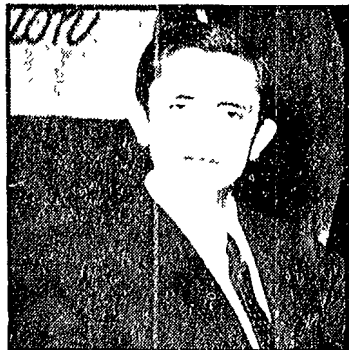
Walter Chiari e Paolo Panelli

Il partito d'Avanguardia, anni dopo, con solennità, commissioni e riprendimenti. Canzonissima, la trasmissione televisiva di cui l'ottavo di (quintotto) ha bloccato, per sei mesi, il nome di Walter Chiari e Paolo Panelli. Da questa settimana, e tramite fra i vari numeri, è Paolo Panelli.