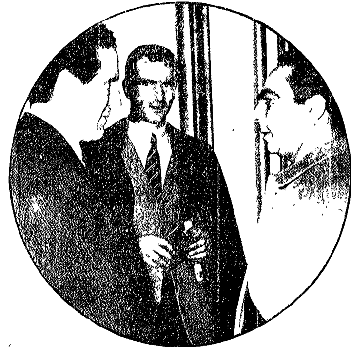
PESAOLA In tre anni con il Napoli non ha mai perso con Herrera la tradizione verrà rispettata anche ora che il «Pelisso» è alla guida della Fiorentina?

Tra le «grandi» solo Napoli, Milan e Torino hanno una partenza facile (in apparenza) contro Verona, Sampdoria e Pisa