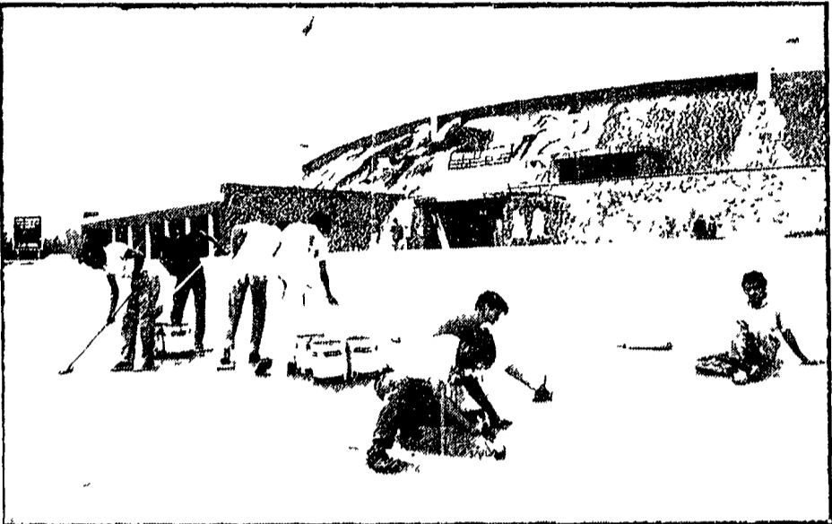
CITTÀ DEL MESSICO — Due immagini della vita della capitale. A destra « Granaderos » armati di tutto punto, con alle spalle i

Oggi l'università sarà liberata e riconsegnata al rettore che ha difeso gli studenti - La battaglia delle scritte sui muri della capitale - Prima vittoria del movimento universitario - Le trattative saranno lunghe e difficili