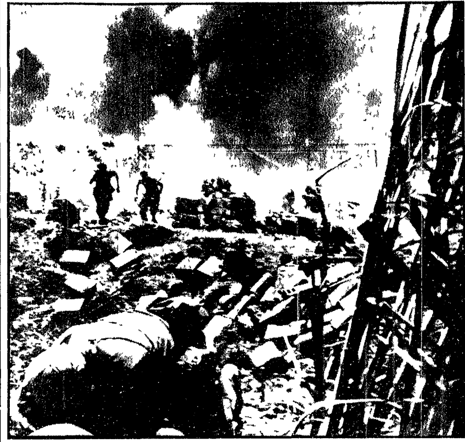
Pesanti perdite americane a Danang. Gli aggressori americani hanno ammesso di aver avuto terribili perdite nel corso di un violento scontro presso la base di Danang.

Si tratta dei procedimenti intentati per le lotte sindacali, politiche e universitarie degli ultimi due anni. Una cifra che denuncia la gravità della repressione scatenata dal governo Moro-Nenni e continuata dal governo Leone.