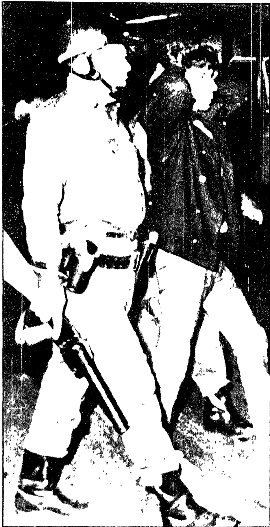
CITTA' DEL MESSICO — Due granaderos spingono per piazza Tlatelolco uno studente fatto prigioniero