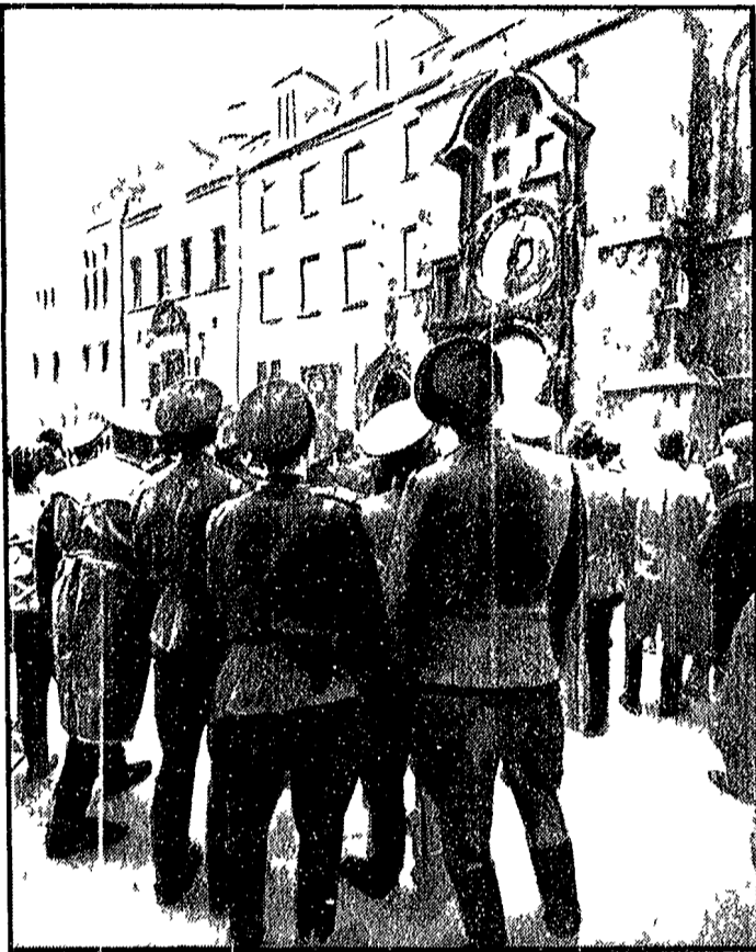
PRAGA — Soldati sovietici ammirano assieme ai turisti dominicali le bellezze della vecchia Praga

Riunito il Presidium per discutere i risultati dell'ultimo incontro di Mosca. Voci incontrollate di possibili dimissioni di alcuni dirigenti - Un articolo del «Rude Pravo» sulla politica dei blocchi