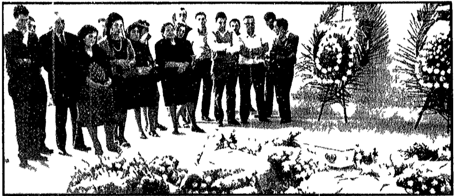
Un momento dei funerali dei sette neonati morti a Frosinone, nel reparto pediatrico dell'ospedale Umberto I

Con questa stampa in famiglia per poche settimane quest'attualità del Ministero della Sanità «L'Unità» non si è mai occupata di un tema così delicato. Il fatto che un neonato sia morto in ospedale è un evento che suscita in ogni famiglia un grande dolore. Ma quando si tratta di una epidemia che ha ucciso sette neonati, il dolore si trasforma in angoscia e in una ricerca disperata di verità.