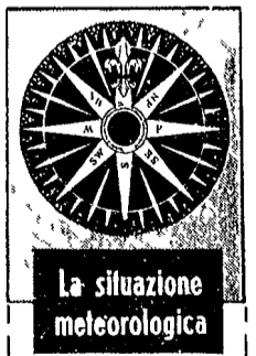
La situazione meteorologica