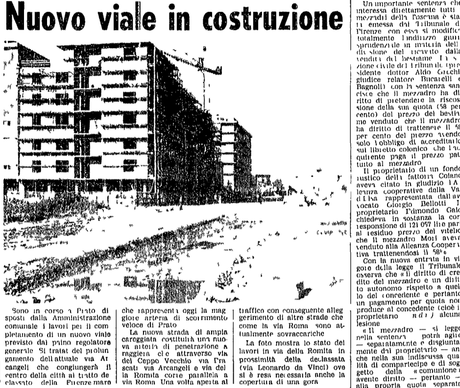
Prato. Nuovo viale in costruzione

Sanciti da una sentenza i diritti dei mezzadri