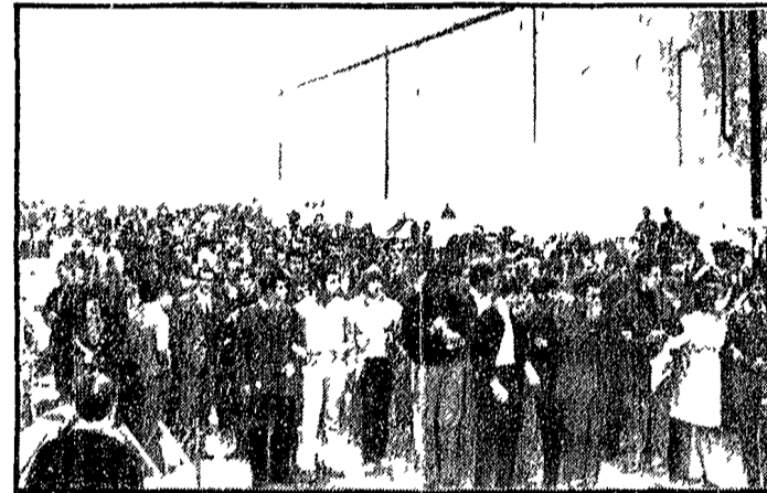
Decine di province depresse sono in lotta per l'annullamento delle «zone salariali». Oggi mani festose a Cosenza...