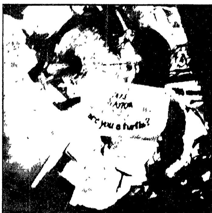
HOUSTON — L'astronauta Walter Cunningham all'inizio del contatto televisivo con il centro spaziale americano, mostra un cartello indirizzato al direttore di volo a terra

A New York lo scienziato sovietico Sedov ha detto dal canto suo che per i sovietici non è un fatto prioritario far scendere un uomo sulla Luna. Saranno invece compiute altre esperienze con le sonde Azonda. Sedov ha detto che l'URSS prevede ancora l'invio di laboratori intorno alla Luna di stazioni automatiche sui pianeti del sistema solare e la discesa morbida di apparecchi su questi pianeti.