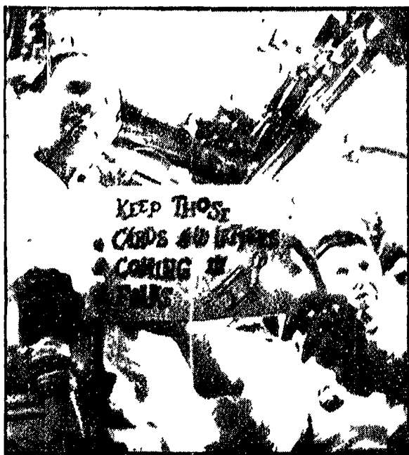
Un'immagine del primo collegamento TV con la base