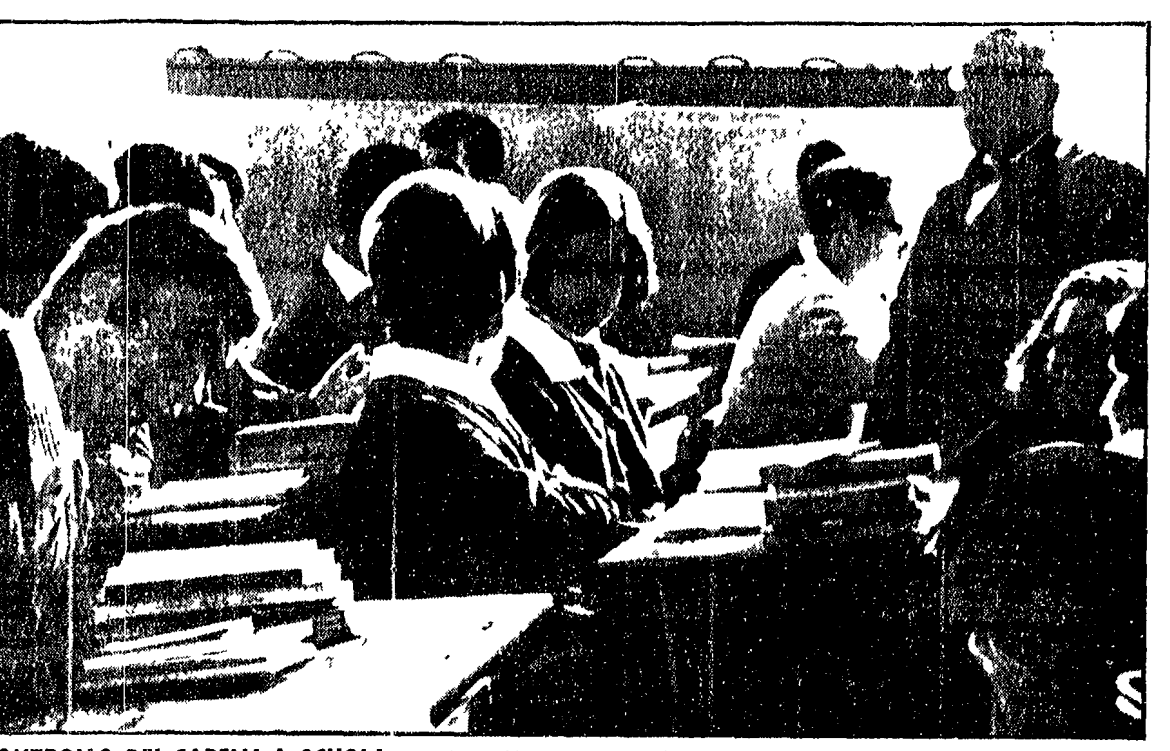
Il preside del Pimo verifica la lunghezza della sfumature, delle basella e delle barbe per essere sicuro che gli studenti abbiano obbedito alle disposizioni da lui impartite nei giorni passati.

Il problema vale soprattutto nella prospettiva congressuale. Il problema vale soprattutto nella prospettiva congressuale. Il problema vale soprattutto nella prospettiva congressuale.