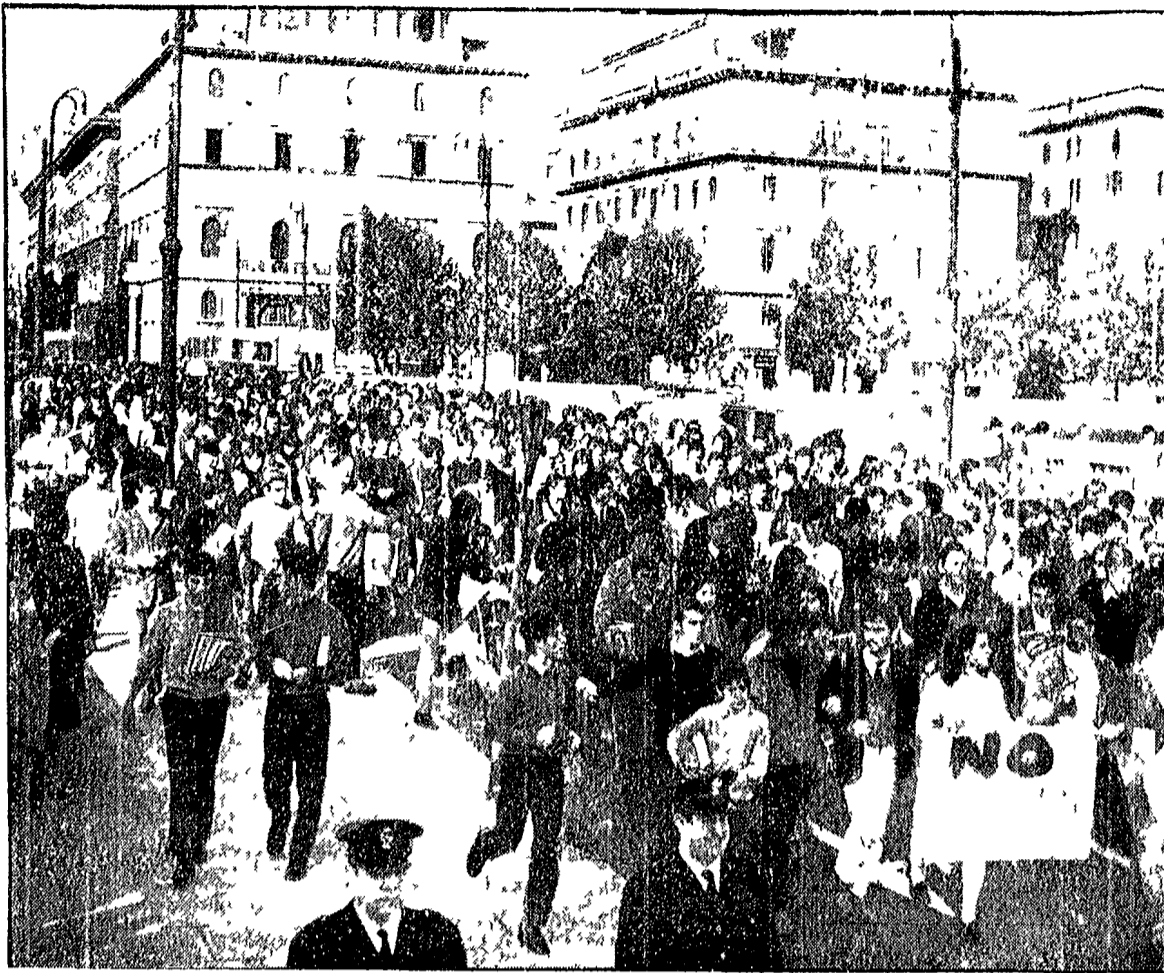
Presidi e polizia non spezzano il fronte degli studenti medici