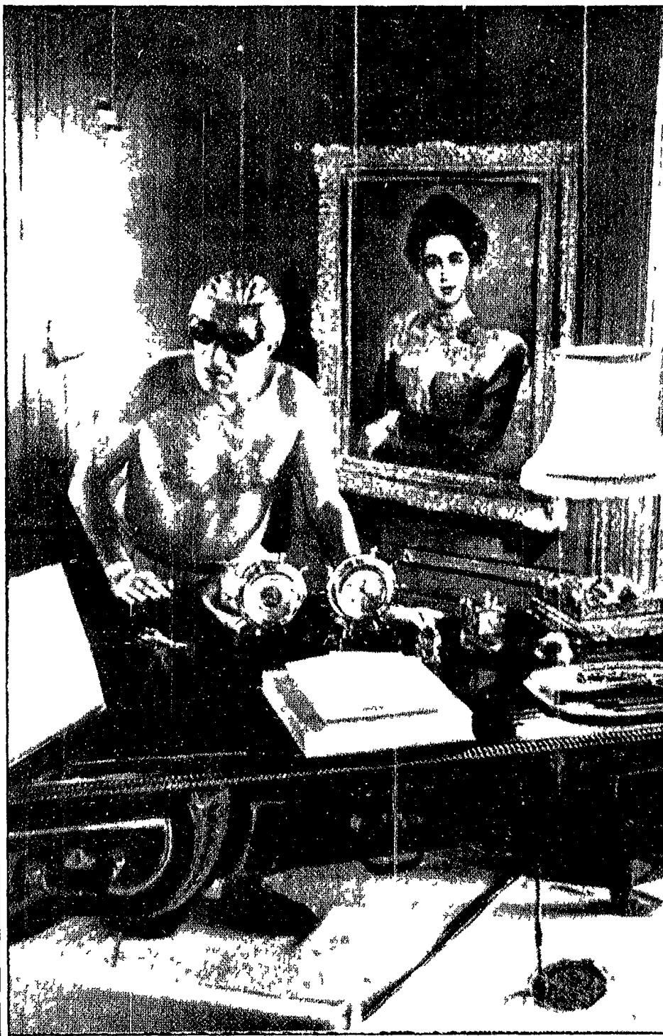
Questa è la stanza cosiddetta di lavoro di Aristotile Onassis a bordo del «Christina», il ricco armatore greco vi si è fatto fotografare qualche tempo fa piuttosto compiaciuto — come si vede — dell'arredamento faraonico che lo circonda.

A luglio scorso si sono incontrati gli «orfanelli del centro sinistra» in un convegno promosso dal movimento giovanile del socialista e del sta. Tutti insieme hanno concluso che innanzitutto bisognava spezzare il perimetro chiuso della forza politica che rappresentavano per costruire una cosa nuova con la sinistra parlamentare e con quella extraparlamentare.